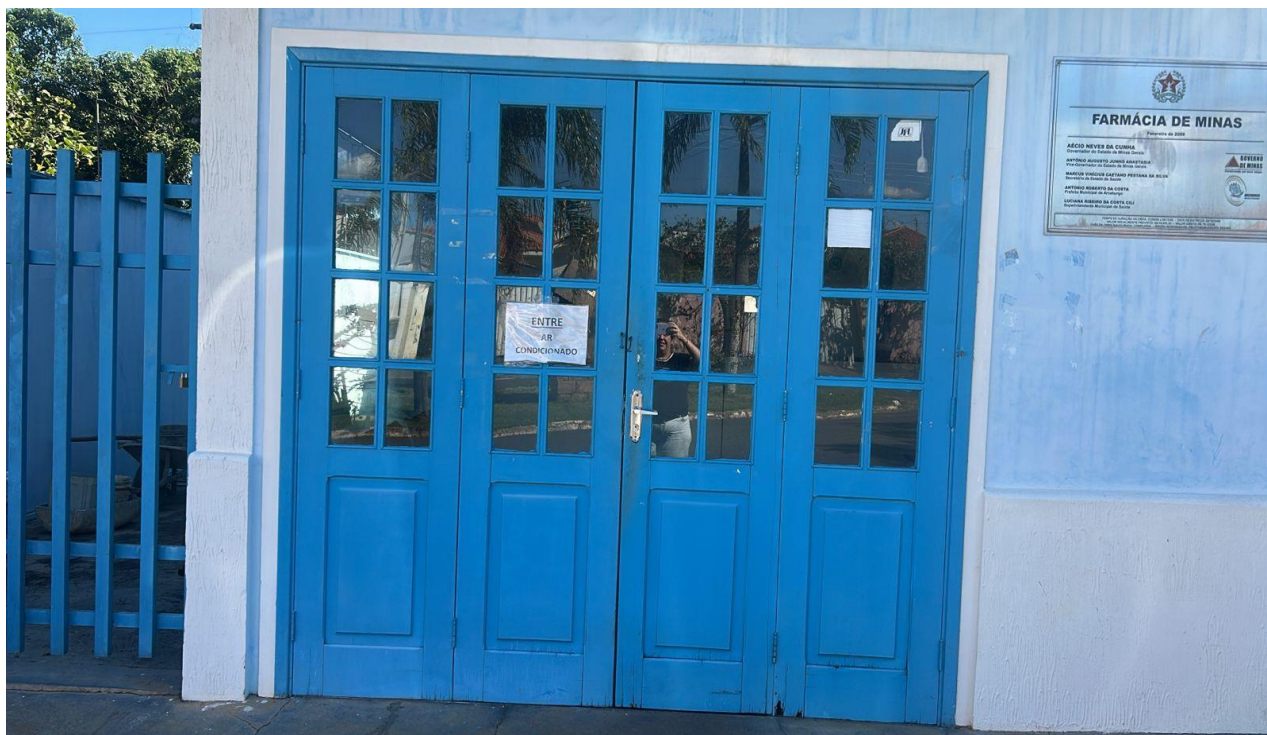
Figura 2 - VISTA EXTERNA DA PORTA QUE SERÁ REMOVIDA