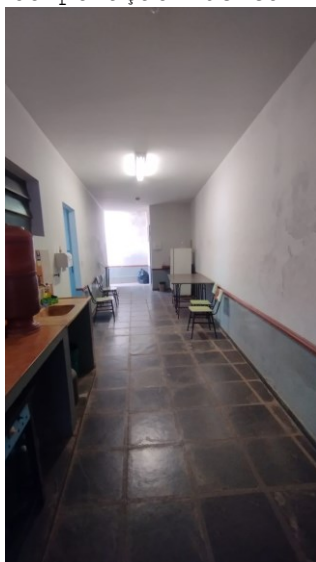
Foto 05: Corredor de acesso ao Banheiro da Corporação M. Imaculada Conceição

Conceição do Rio Verde, 14 de Março de 2025.