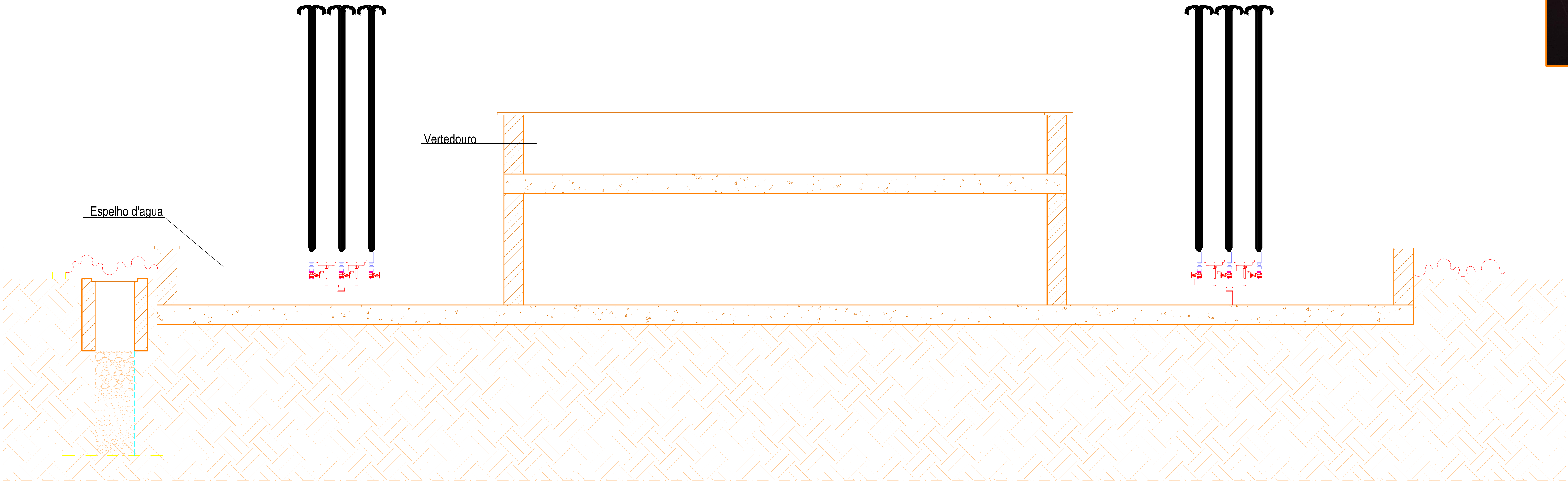
CORTE AA' ESCALA 1:25