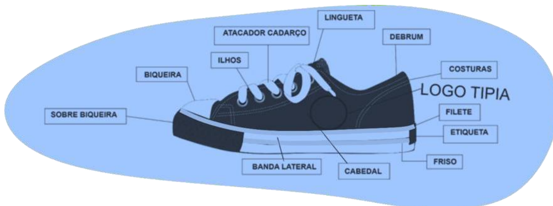
Vista lateral externa (Foto Ilustrativa)

Na ilustração seguinte uma foto do produto para orientação das partes do tênis em questão.