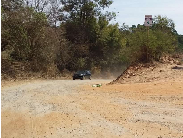
Figura 9. Curva da Estrada da Onça

QUANDO TODOS PARTICIPAM - TUDO SE REALIZA