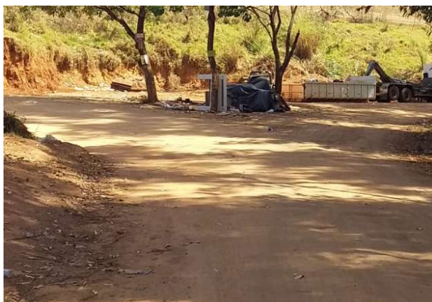
Figura 1. Estrada da Onça