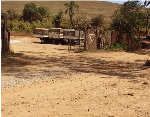
Figura 5. Estrada da Onça