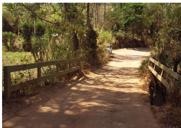
Figura 2. Ponte sobre ribeirão da onça