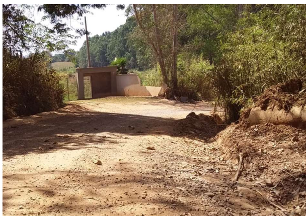
Figura 3. Entrada do sítio.