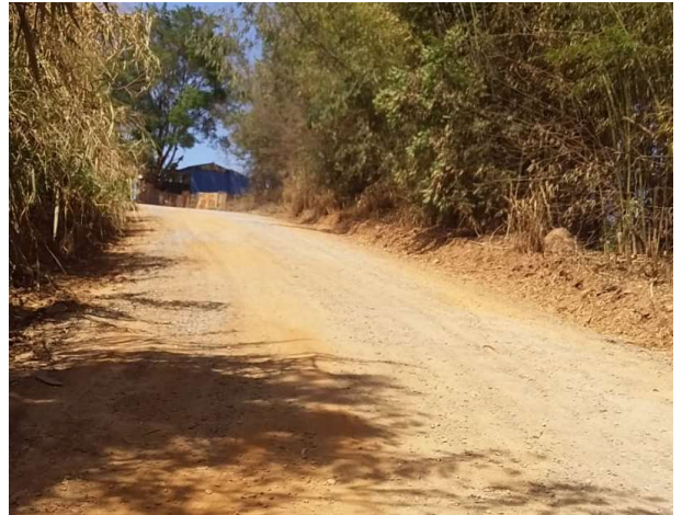
Figura 6. Aclive da Estrada da Onça