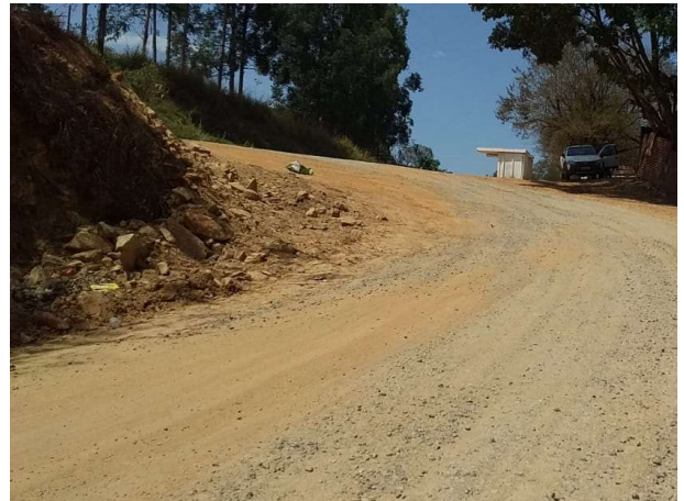
Figura 10. Conexão com a rodovia