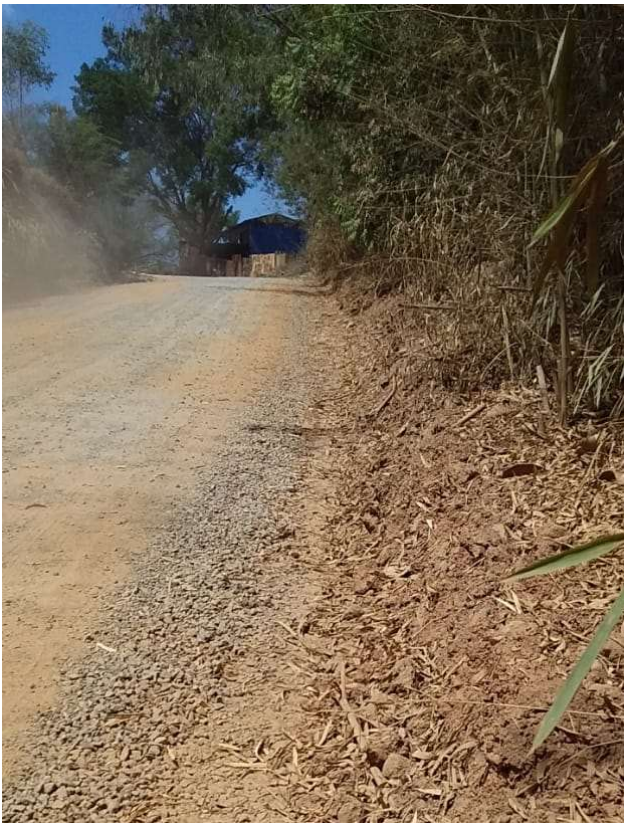
Figura 7. Estrada da Onça