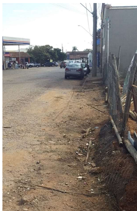
Figura 12. Av. Ver. Tão Lopes ausência de meio-fio na esq. c/ Rua José Maiolini