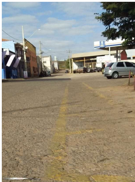
Figura 14. Av. Ver. Tão Lopes