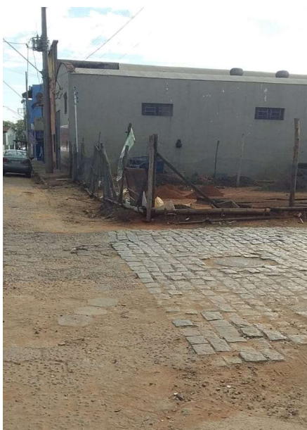
Figura 11. Rua Ver. Tão Lopes esquina. c/ Rua José Maiolini