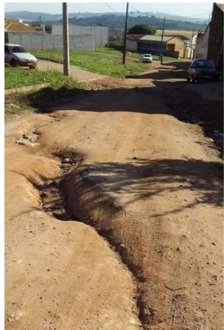
Figura 8. Av. Ver. Tão Lopes