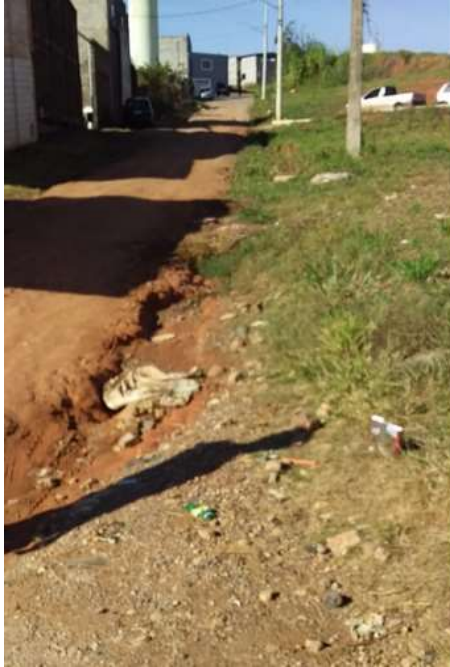
Figura 5. Ausência de meio fio e sarjeta