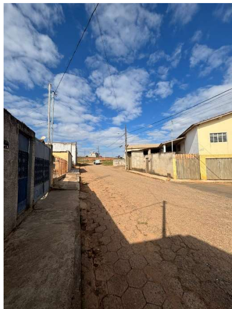
Figura 2. Av. Ver. Tão Lopes