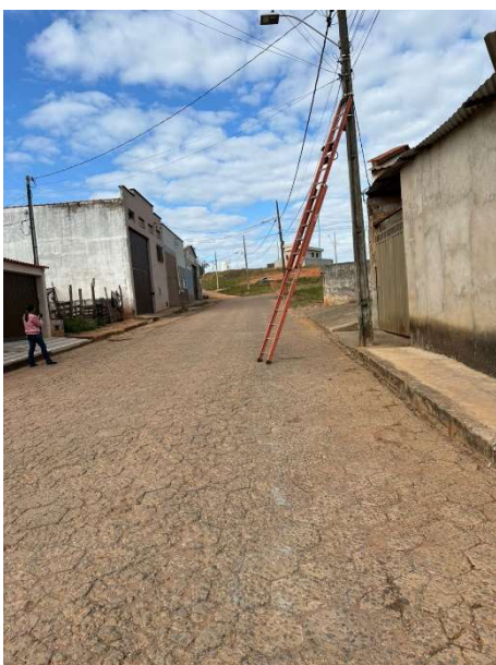
Figura 3. Av. Ver. Tão Lopes