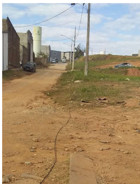
Figura 4. Av. Ver. Tão Lopes