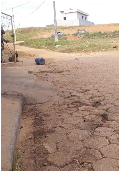
Figura 7. Calçamento existente na Rua Ver. Tão Lopes