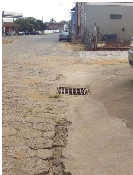
Figura 10. Av. Ver. Tão Lopes próximo à esquina com a Rua José Maiolini