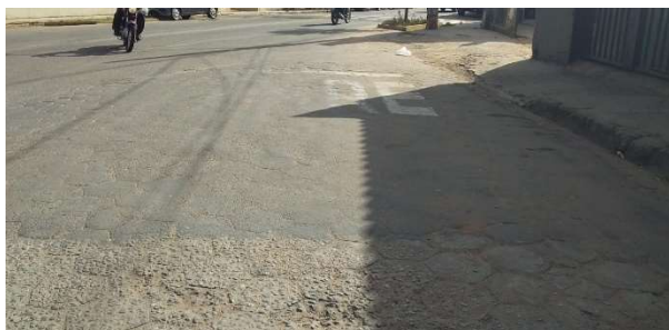
Figura 15. Av. Ver. Tão Lopes esquina c/ Avenida da Paz