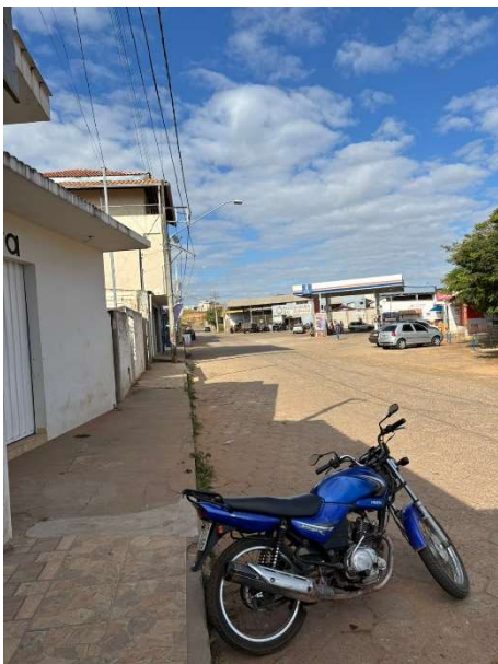
Figura 1. Av. Ver. Tão Lopes