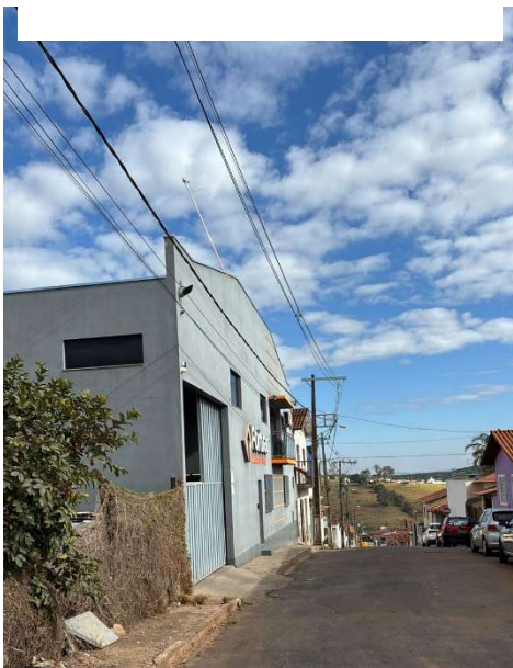
Figura 09. Av. Ver. Tão Lopes esquina c/ Rua Joaquim Evangelista