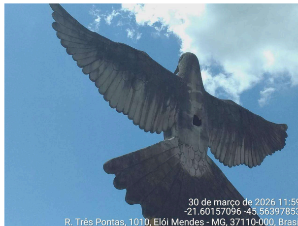
Visão posterior da escultura