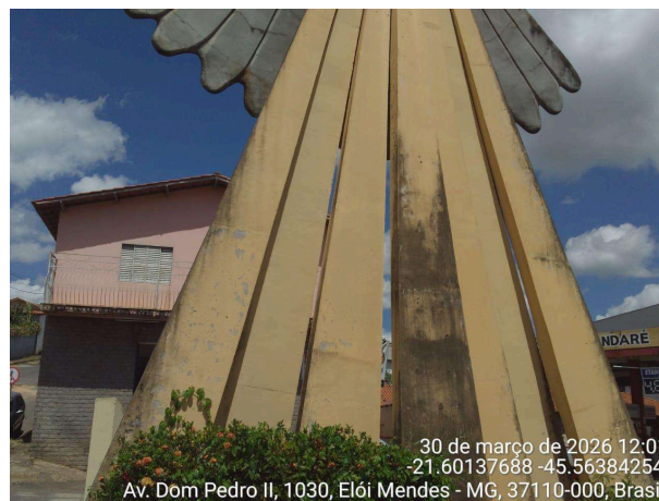
Detalhe da base/estrutura da escultura (raios do Espírito Santo)