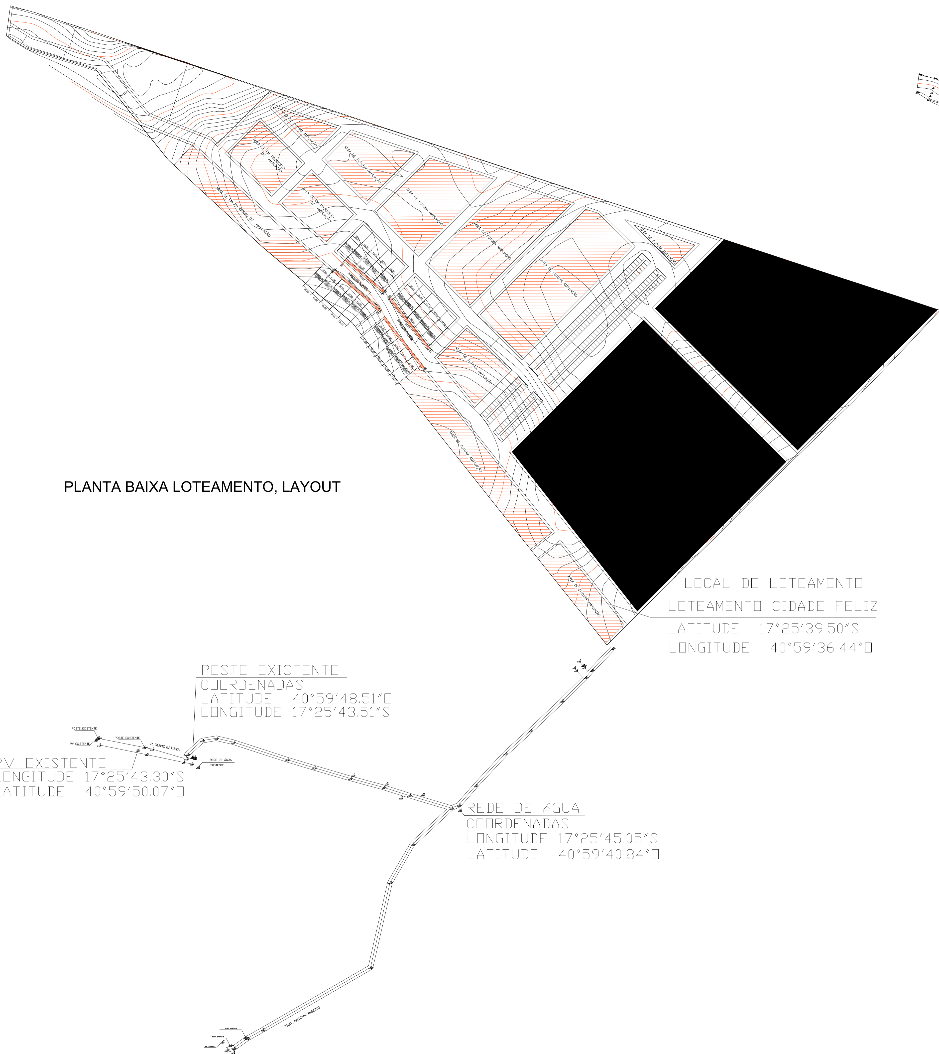
PLANTA BAIXA LOTEAMENTO, LAYOUT