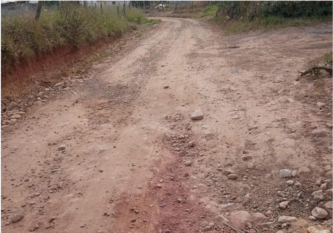
FOTO 3 – FOTO DO TRECHO DA ESTARADA VICINAL DO BAIRRO DO CAXAMBU - SENADOR AMARAL – MG