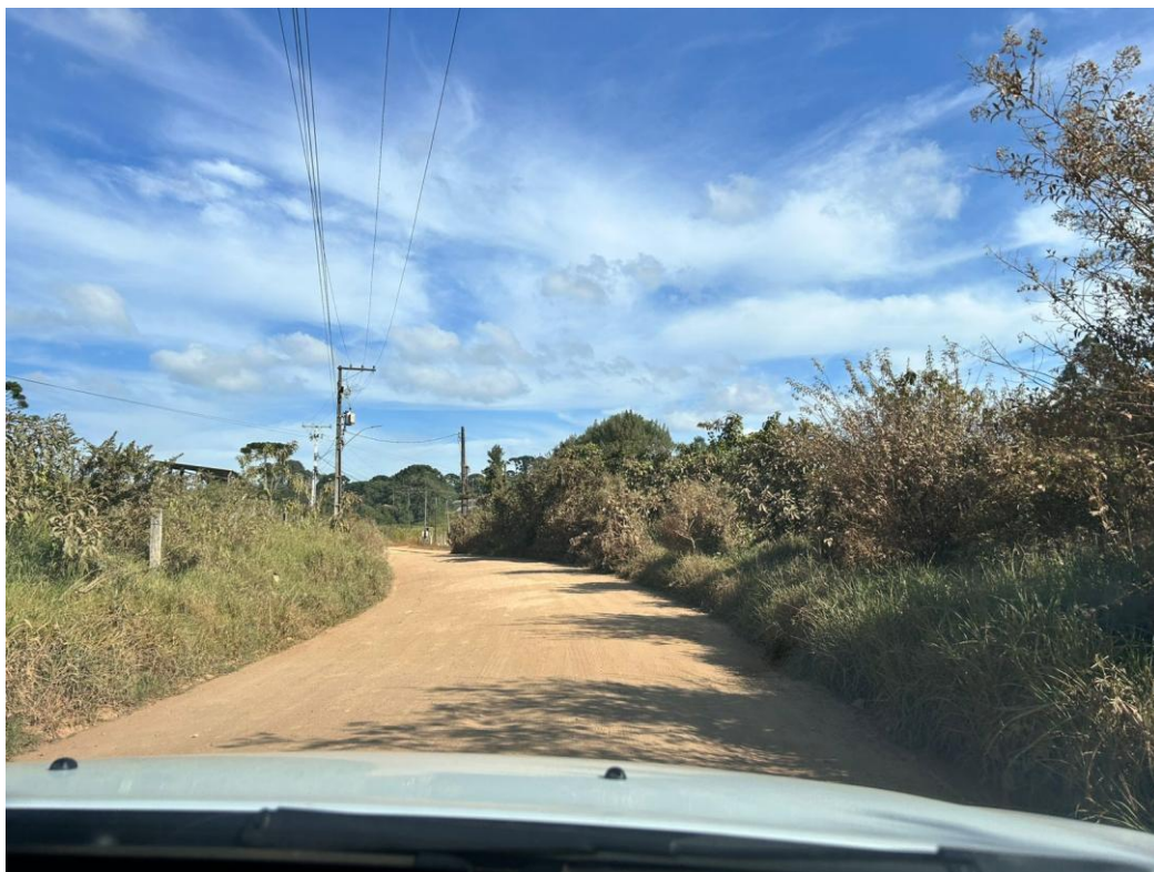
FOTO 3 – FOTO DO TRECHO DA ESTARADA VICINAL - SENADOR AMARAL – MG.