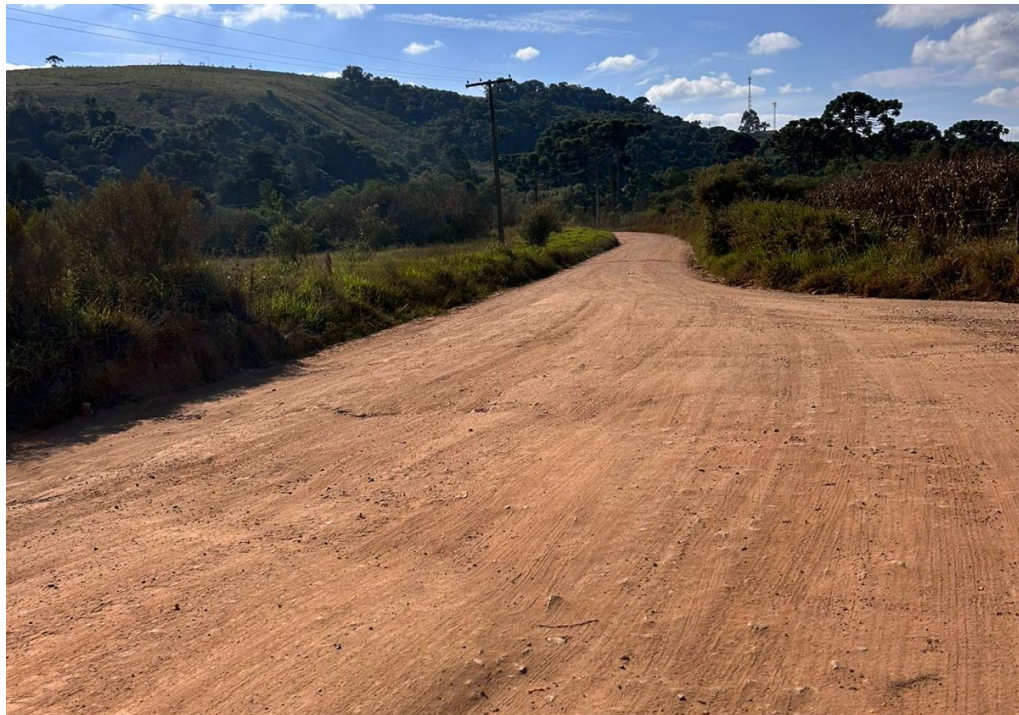
FOTO 2 – FOTO DO TRECHO DA ESTARADA VICINAL - SENADOR AMARAL – MG.