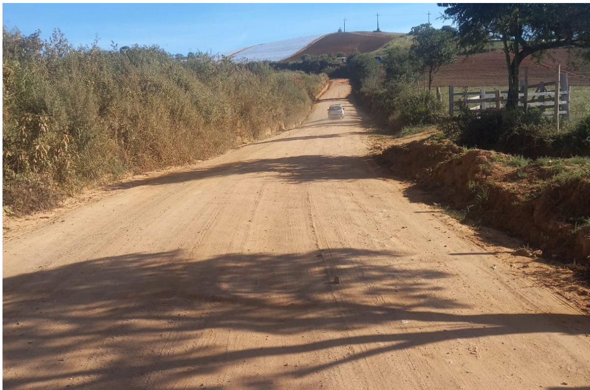
FOTO 2 – FOTO DO TRECHO DA ESTARADA SENTIDO BUENO BRANDÃO - SENADOR AMARAL – MG